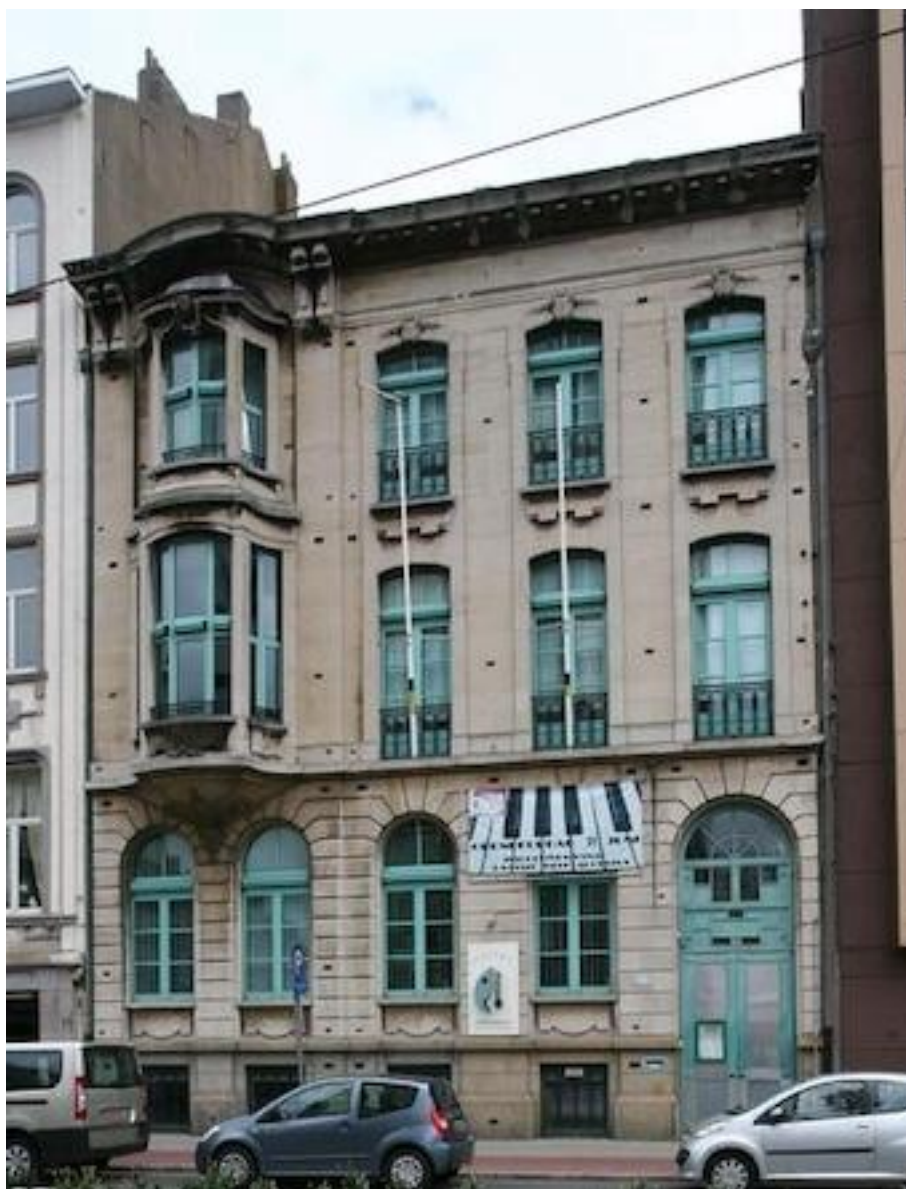
(het eindstation zaal Gruter op de Mechelsesteenweg)

Punt aan de lijn en gene zever (of toch een beetje).