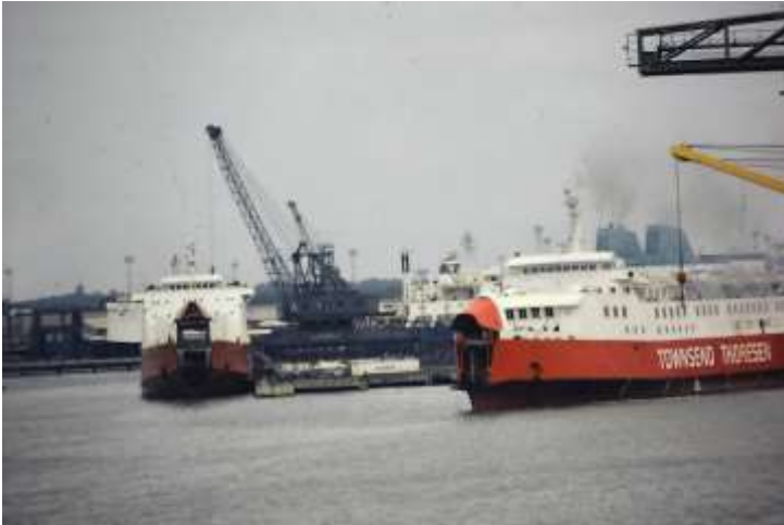
(1978 Port of Felixstowe)

“Om het normale zeeverkeer niet te hinderen”, riep iemand die het scheen te weten. Het enige dat ik wist, was dat dit klein ding, dat vanaf de brug van een zeeschip amper te zien was, gevaarlijk begon te slingeren en te stampen, maar “mijn” chef-kok bleef maar doorzeuren en aan zijn adem was duidelijk te merken dat hij de voorbije dertig jaar ook nog andere elementen van de zeevaart had geleerd.