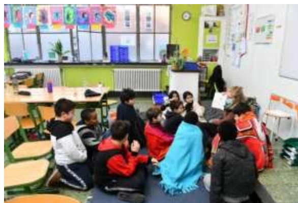
(GVA 9 december 2020)

...diezelfde directeur met zijn leerkrachten al dadelijk begon met een actie: "breng een dekentje voor onze leerlingen", want omdat de leerlingen van Toermalijn (Sint-Norbertus lagere school) de Coronamaatregelen goed willen opvolgen, is er ook verluchting nodig in de lokalen en dat zorgt soms voor bibberende lijfjes bij de 150 leerlingen. Wie nog dekentjes op overschot heeft, kan ze altijd bezorgen op de school: Amerikalei 47.