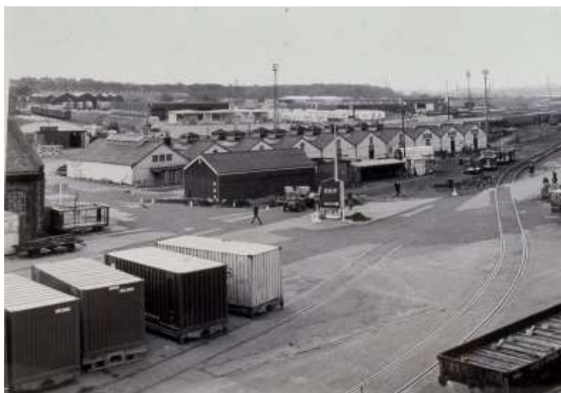
(1978 Harwich Dock Navyard)

Harwich was zo'n typische Engelse uitvalshaven aan de oostkust, met kaaimuren, aanlegsteigers en pontons van rond 1940, nagelnieuw dus, waar - met een beetje verbeelding - mijnenvegers en ander soortgelijk oorlogstuig net afgevaren waren.