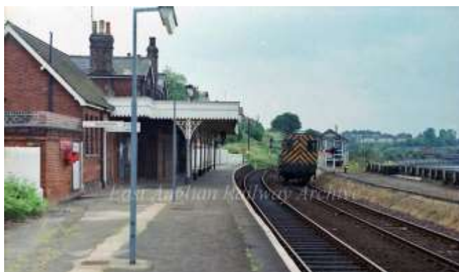
(Britisch Rail – Manningtree)