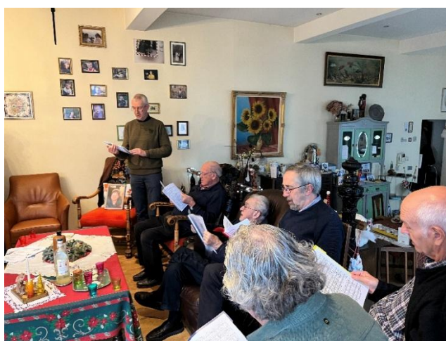
Klaar voor het kerstzingen