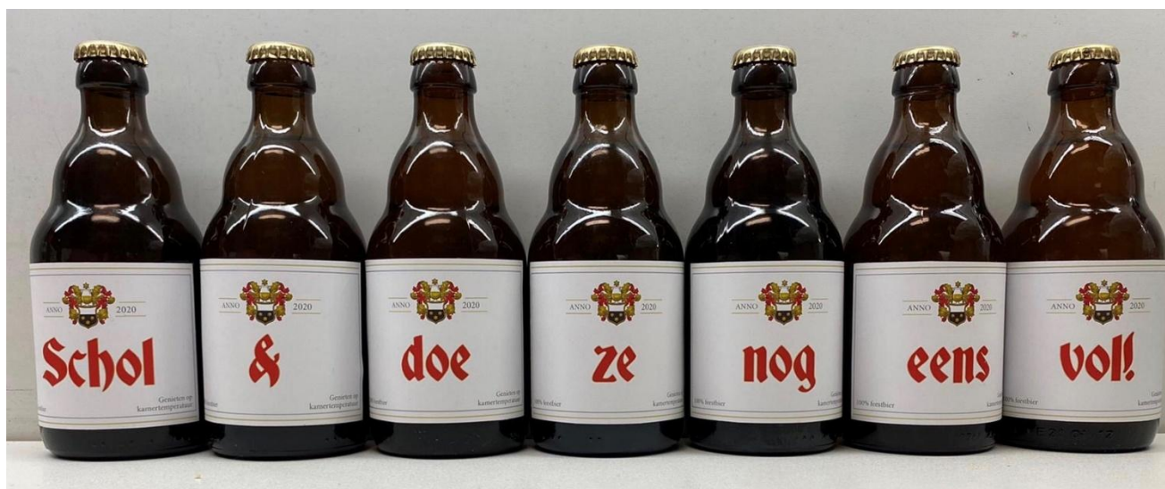
(website van brouwerij Moorgat - DUVEL)

Dat we dit allen samen nog lang mogen meemaken.