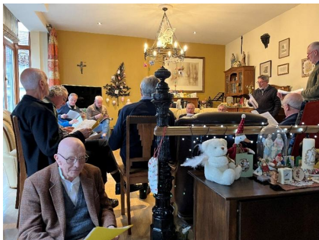
Als gastheer meezingend vanop de trap