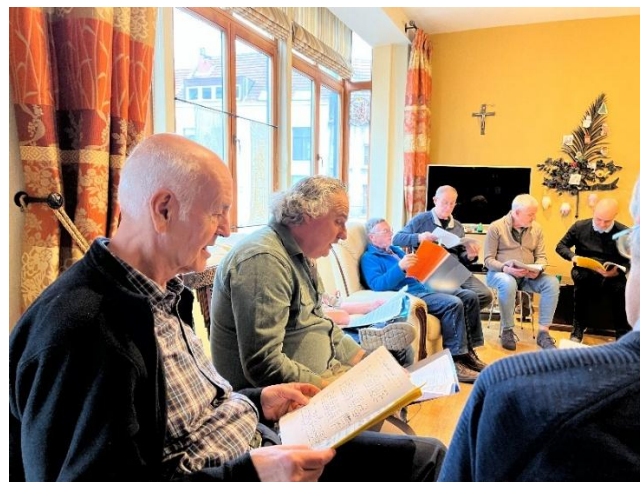
Aanvang van de repetitie