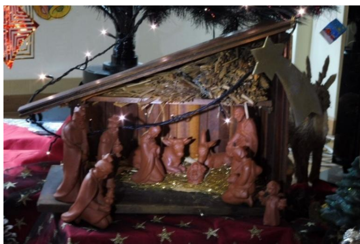
Nog vlug een bezoekje aan de kerststal in het salon