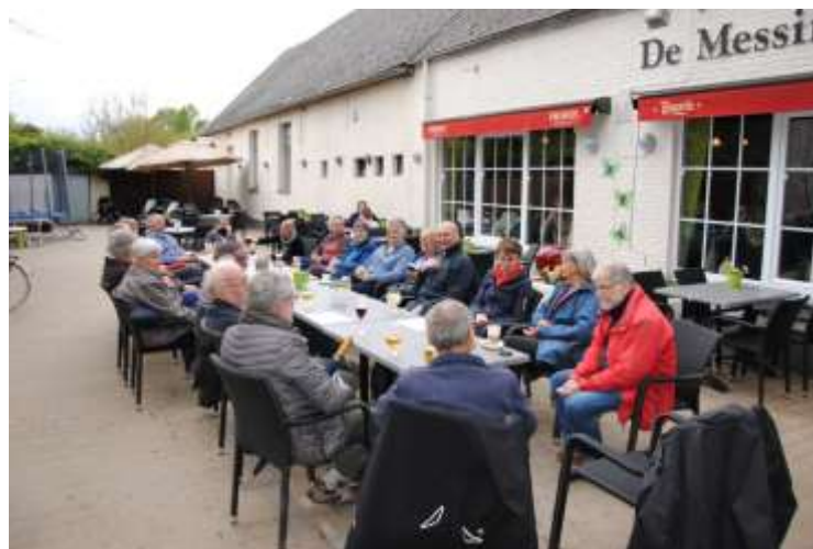
Nog een afzakkertje?