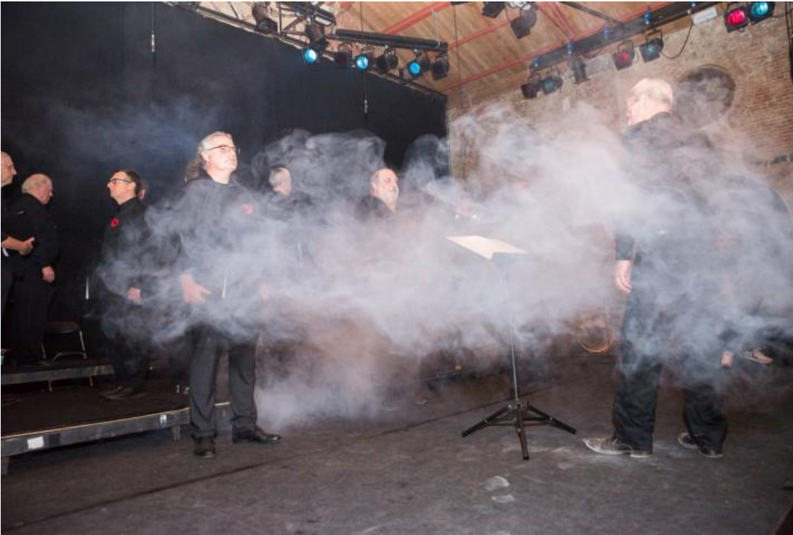
Het rook(d)effect ,