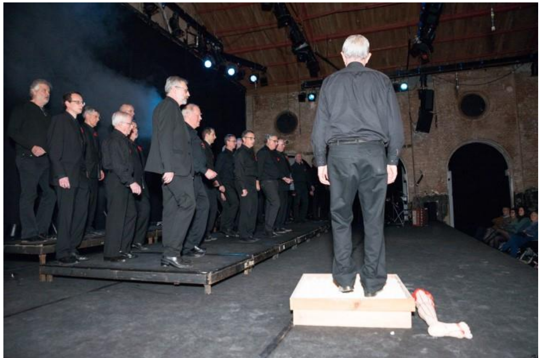
De Moorsoldaten op stap.