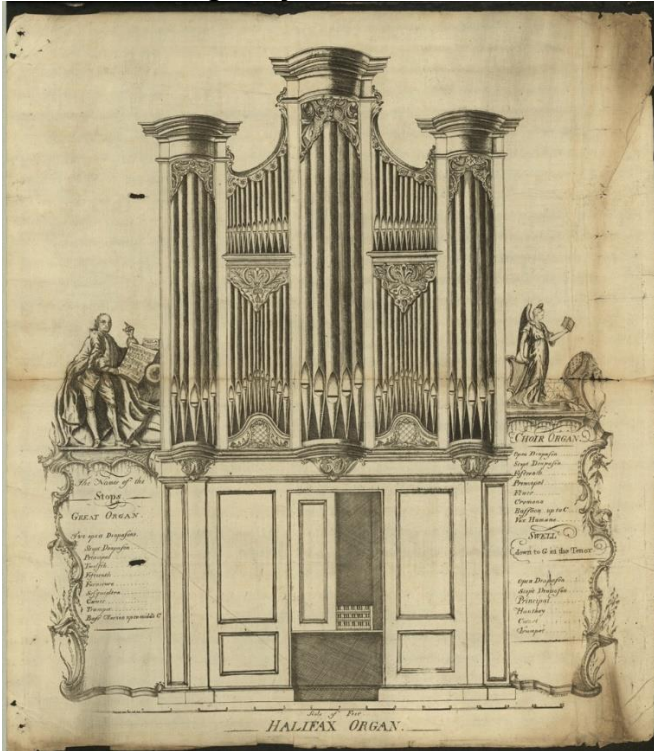
Het Snetzler-orgel met rechts de H.-Cecilia en links een afbeelding van Händel met een tekst uit de ‘Messias’.

“Ik heb dat eigenlijk zelf de naam ‘Händel-orgel’ gegeven, maar het orgel werd