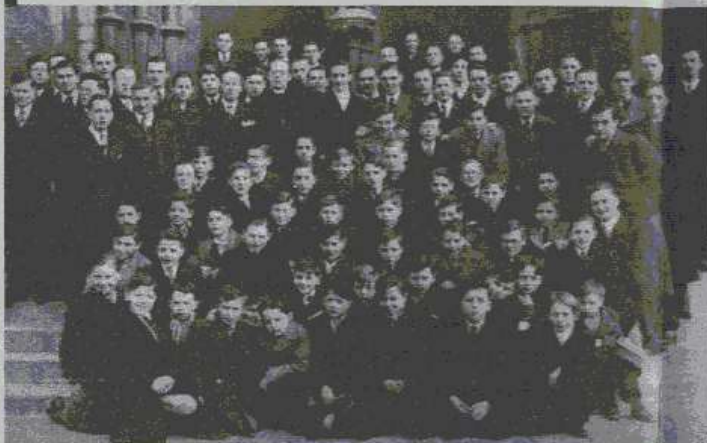
Volledig koor : mannen en kinderen, gekiekt voor de St. Willibrorduskerk

Greeve. Het was inderdaad in 1913, tijdens het Paaschverlof, dat door zes studenten van het St.-Norbertusgesticht te Antwerpen, een kringetje werd opgericht onder motto « Ich dien, ich darf, ich doe ». Doel : de algemeen-menschelijke, bovenmenselijke, godsdienstige en specifiek-Vlaamse vorming der leden. De omstandigheden waren oorzaak dat de organisatie den concreten vorm van een zangvereniging aannam.