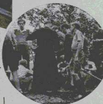
De name aan den Pater Damiaanstoet (1936) gekiekt voor het St. Norbertusgesticht.