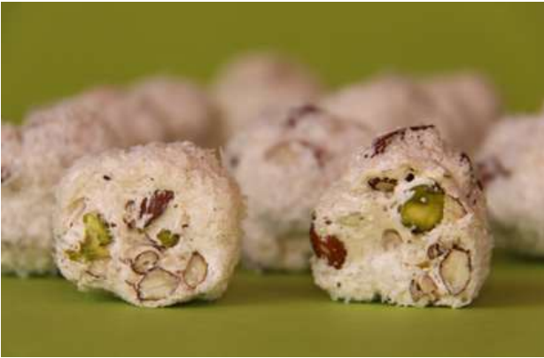
Nu nog nougabollen

!!!!!! Het heden ..... en in de verre toekomst !!!