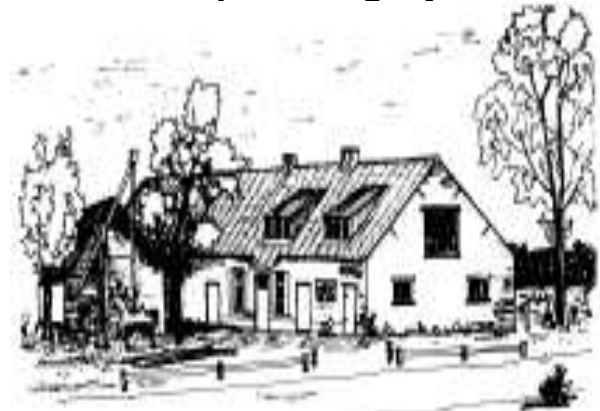
RADESKE 50 jaar+